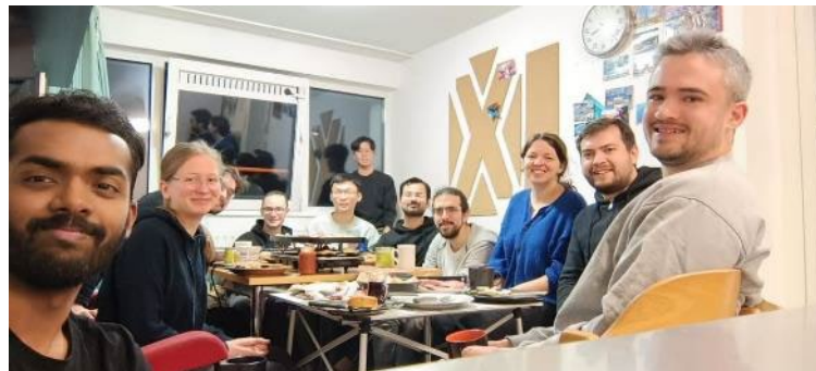
フラットメイトとラクレット