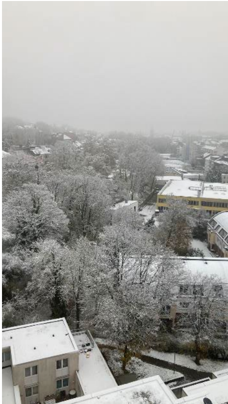
雪の日のアーヘン