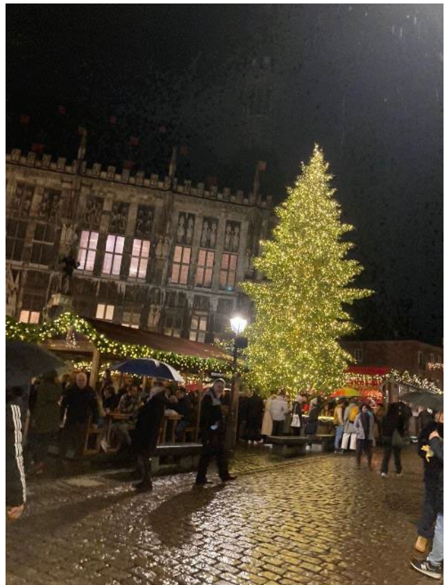
アーヘンのクリスマスマーケット