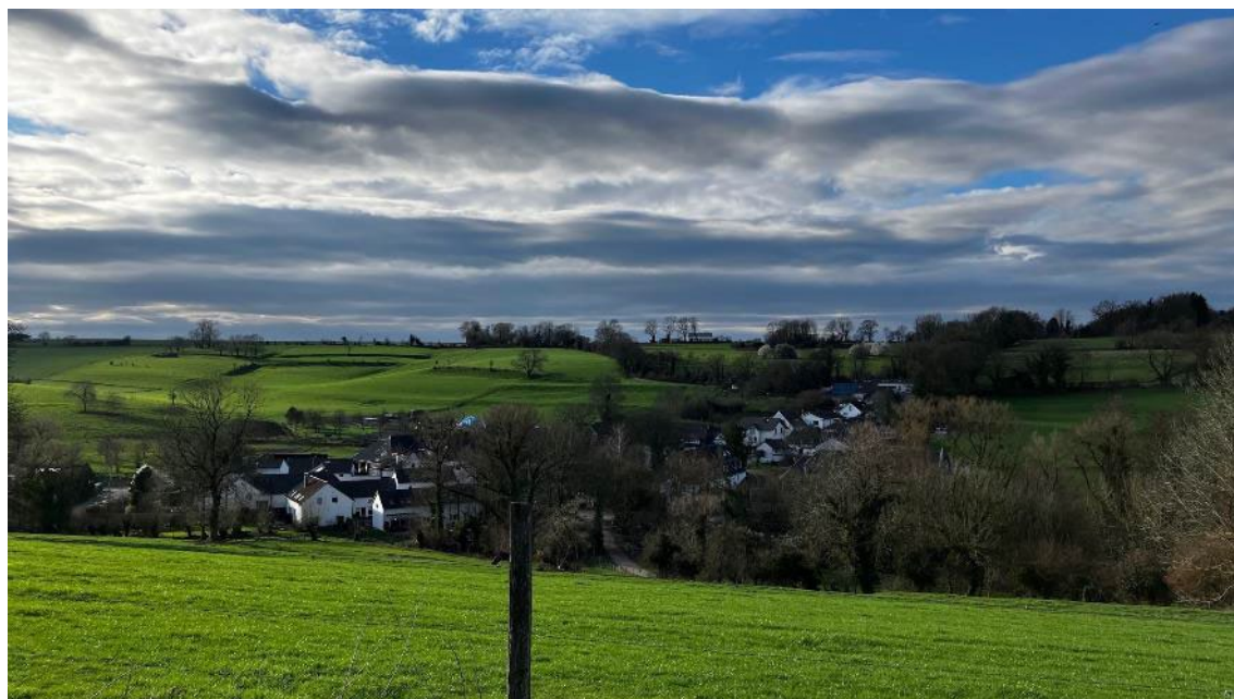
アーヘンの町外れ