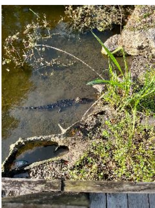
大学近くの湖、ワニが見られます