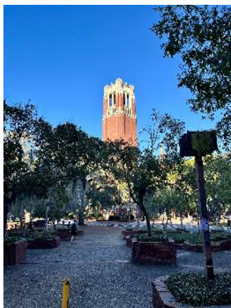
学校のシンボルトワー