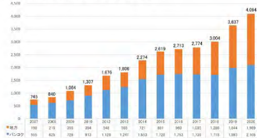
図 タイにおける日本食レストラン数の推移(単位:店舗)